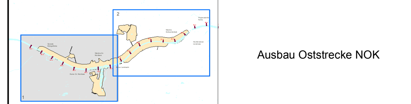
Ausbau Oststrecke NOK